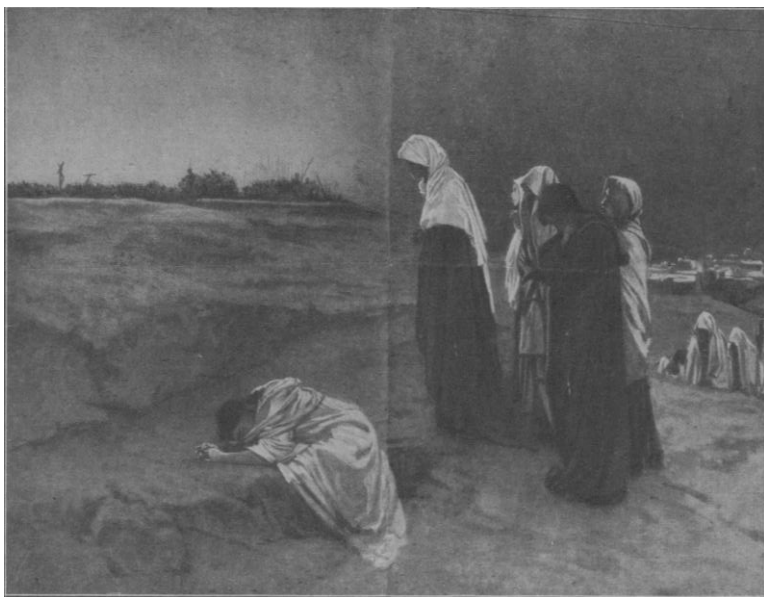
Golgata af Domenico Morelli.

gemets) er indsatsen. Jeg tænkte over hans ord en stund og følte mørket lige ved mig. "Frygt ikke! Det standser her," sagde han, "hvad vil du?" På mit svar: "Jeg følger dig, hjælp mig!" faldt bommen, og vi vandrede ind i lyset, ind i den verden, der kommer, når mennesket vender sig til sin samvittighed, således følte jeg det.